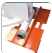
Livré avec tapis de freinage bord de bassin